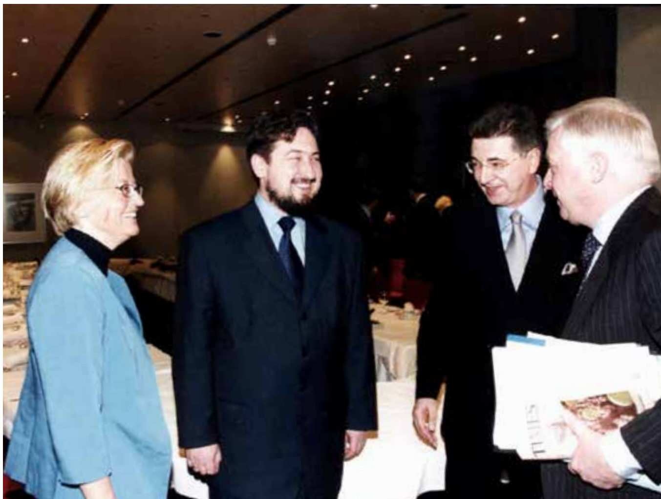
Ана Линд, министер за надворешни работи на Шведска и претседател на Европскиот совет разговара со Љубчо Георгиевски, премиер на РМ и Срѓан Керим, министер за надворешни работи на РМ и Кристофер Патен, член на Европската комисија пред потпишувањето на Договорот за стабилизација и асоцијација. Македонија беше првата земја од Западен Балкан која успешно ги заврши преговорите и потпиша таков договор со ЕУ.