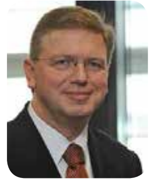
Штефан Филе, комесар за проширување на Евроската Комисија

Како европски комесар за проширување, кој е одговорен за политиката на проширување, ја користам оваа пригода, преку монографијата што ја подготвувате за десетгодишнината од стапувањето во сила на Договорот за стабилизација и за асоцијација, да Ви ја честитам десетгодишнината од неговото спроведување.