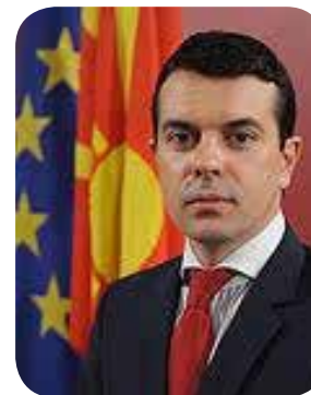
М-р Никола Попоски,

министер за надворешни работи на Република Македонија